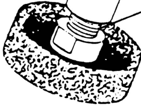
■ Otáčením doleva se kotouč odtláčuje od vrtáku Otáčením doprava se kotouč přitlačuje k vrtáku